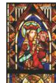
Fenster (um 1300)