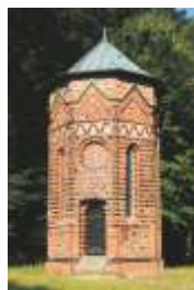
Beinhaus am Münster

* Schwerbehinderte, Studenten, Arbeitslose, Azubis Abendkarte: letzte 30 min der Öffnung 1,50 € p.P.