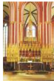
Hochaltar (um 1300)