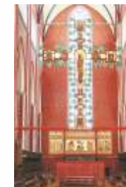
Kreuzaltar (um 1360)